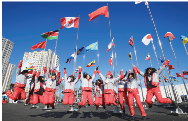
2月1日,在韩国江陵,志愿者们在奥运村內拍照合影。第23届冬季奥运会将于2018年2月9日至25日在韩国江原道平昌举行。 新华社 欧新

普京1月30日表示,俄方不想激化局势,将耐心等待在美方准备好的情况下修复双边关系。俄方暂时不会采取反制措施,将密切关注形势走向。他说,尽管俄罗斯在很多问题上表现出极大忍耐,但不会无休止地让步。普京还呼吁人们用更多精力关注俄罗斯自身经济社会发展,不要过多关心美方的报告。