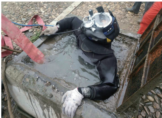
▲施工人员加班加点施工,开展清淤作业