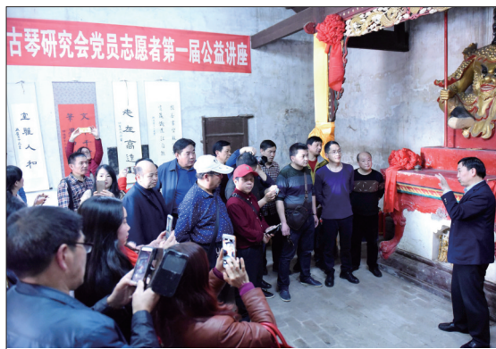
3月15日下午,由市委宣传部指导、市文联主办的《我们大邵阳》主题文艺创作工程在市区正式启动。来自市委宣传部、市文联、市直各文艺家协会、各县市文联的80余人参加启动仪式,并在市区开展社区行、景区行、园区行创作采风。图为文艺家们在市区古卸甲坊进行创作采风。

民警勘查现场后于3月14日凌晨3时归队,对驾驶员段某志的驾驶信息和车辆信息进行联网查询,段某志持“B2”机动车驾驶证,湘K65***重型自卸货车未年检,事故原因还在进一步调查处理中。