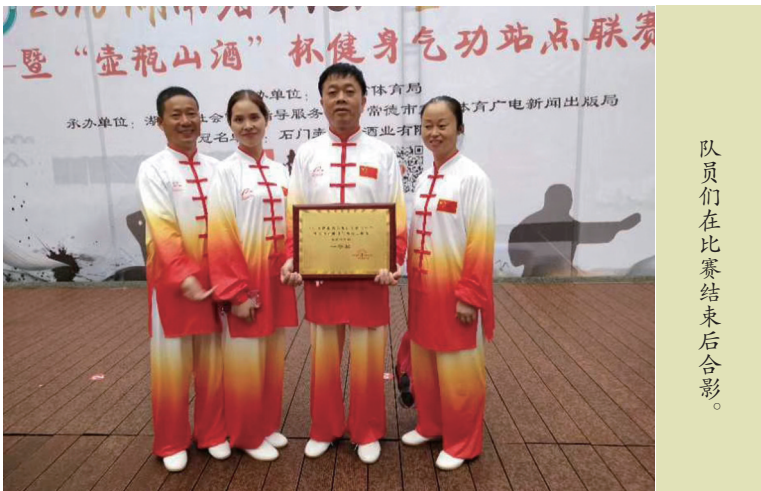
队员们在比赛结束后合影。

今年9月22日至23日，湖南省第九届全民健身节健身气功站点联赛在常德市举行，全省共有59个站点参赛，北塔区状元洲健身气功站第五次参赛，获五禽戏和马王堆导