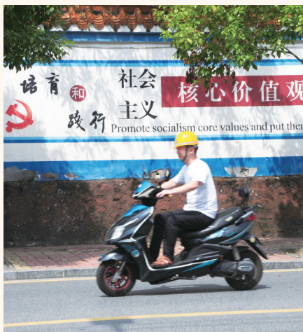
邵阳街头随处可见“社会主义核心价值观”宣传。

“一花引得百花开”，邻居节活动吸引了大量相关单位积极参加。电力、自来水、燃气、通信、医疗、旅游、金融、法律、保险等70多家民生单位的3000多名志愿者纷纷走进社区，热心为群众提供志愿服务。同时，300多名爱心人士给小巷深处500多名困境群众送去关爱。