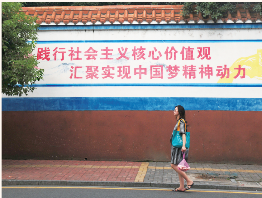
市民从街边的“践行社会主义核心价值观”公益广告前路过。