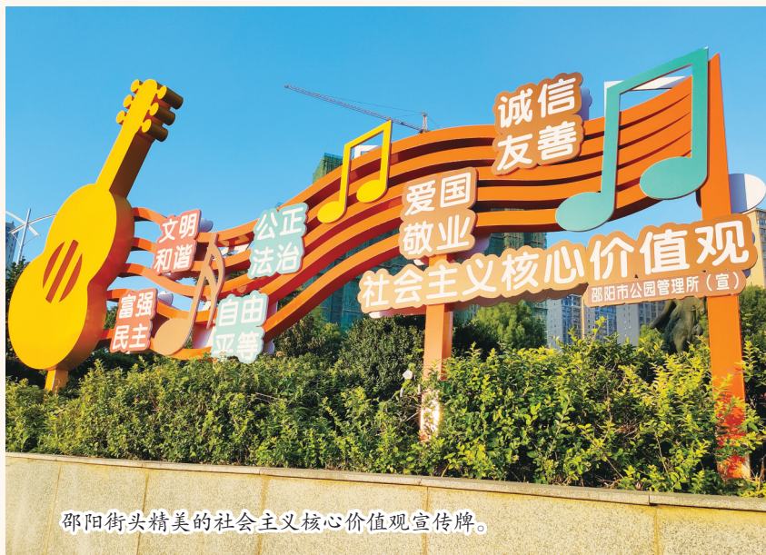
邵阳街头精美的社会主义核心价值观宣传牌。