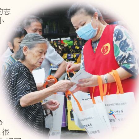
▲志愿者在带领市民学习《邵阳市文明行为促进条例》。

现在,该社区不仅实现了“五无”目标,即无刑事案件、无治安案件、无居民犯罪、无治安灾害事件、无非法宗教活动,杜绝了黄、赌、毒等社会丑恶现象,邻里关系也十分和睦,杜绝了因民事纠纷调解不及时造成矛盾激化的现象。