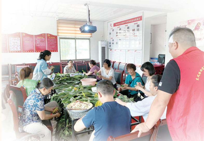
▲社区开展“我们的节日·端午”和谐邻里情包粽子活动。

8月24日,双清区东风路街道铁砂岭社区开展邻居节活动。社区志愿者们走进小区看望慰问困难市民,组织邻里院落会的形式宣讲创文知识,深入街道、店铺,宣传防疫知识、倡导文明诚信经营,来到背街小巷、菜市场,与居民一起清理环境卫生……以实际行动,带动社区居民树立邻里和谐、邻里互助的风尚,引导居民积极投身全国文明城市创建。