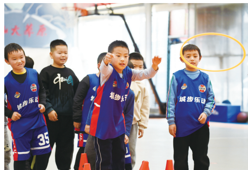
1月14日,城步苗族自治县乐动体育城北馆篮球兴趣班的小朋友开心地在参加课间游戏。近年来,该县在全力推动“双减”政策落实的过程中,注重培养孩子们健康的兴趣爱好。