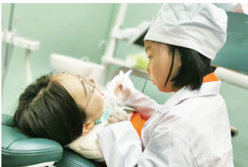
1月14日,绥宁县妇联、妇女儿童服务中心联合开展“爱在我家,牙牙乐”小牙医亲子公益活动,68个家庭组合参与了此次活动。