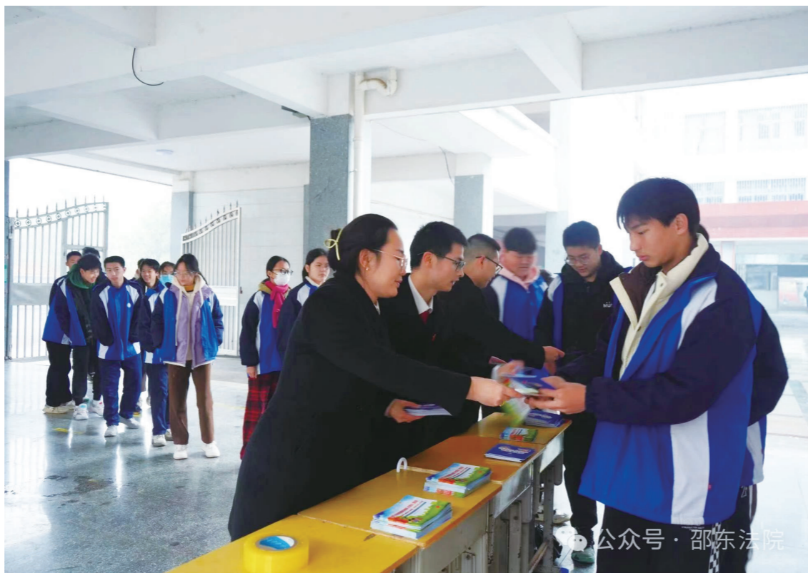
1月15日,邵东市人民法院干警走进邵东市城区二中开展“权益岗在行动:向电信网络诈骗说不”法治宣传活动。图为活动现场。