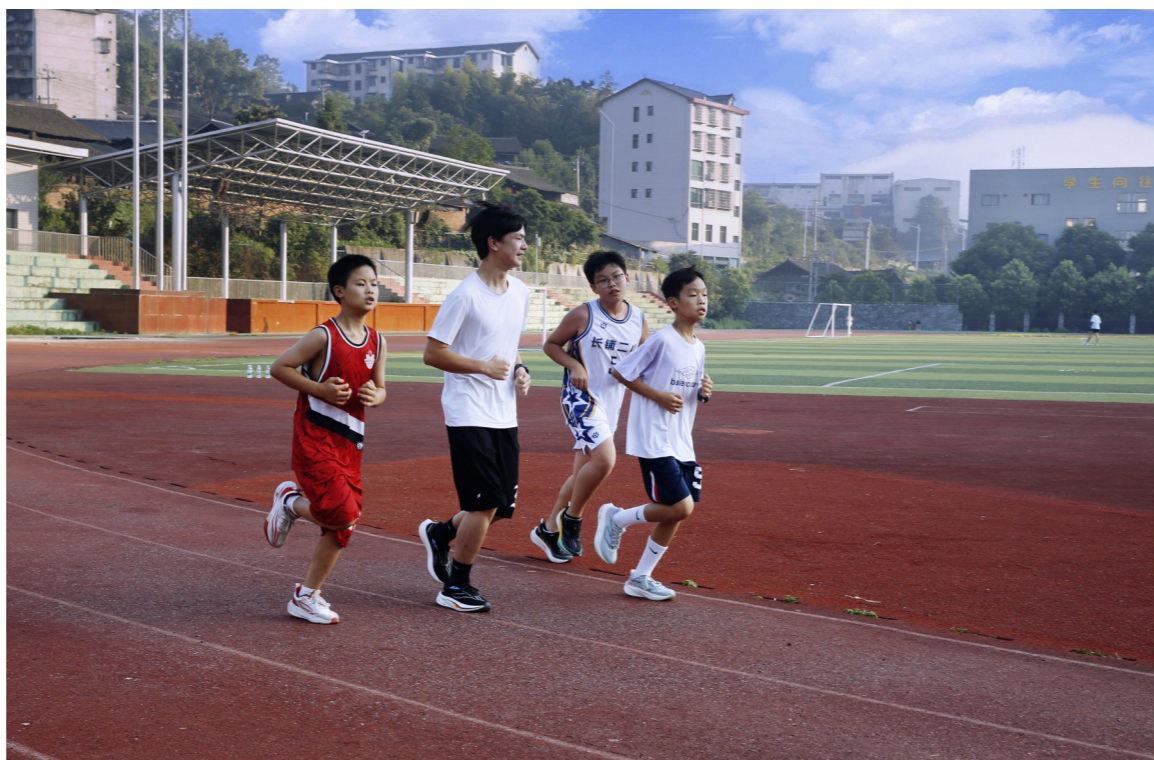
8月8日,在绥宁县民族体育馆运动场地,多名小学生自发组织参加跑步锻炼。暑假期间,该县加强对学生的安全教育,支持学生参加体育健身等文体活动。