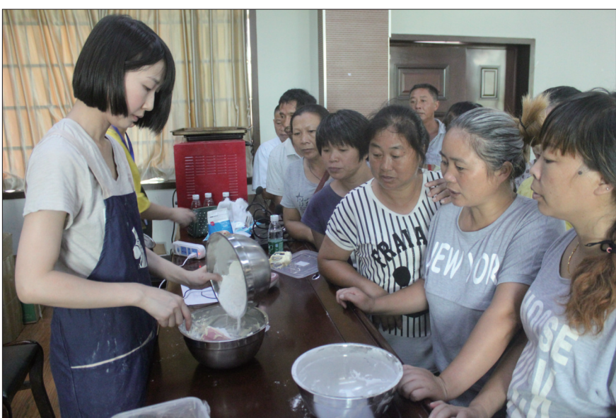
8月24日,大祥区檀江街道举办农村贫困人员劳动就业技能培训班,共安排50名建档立卡贫困户开展为期10天的西式面点师培训。图为培训老师正在现场指导学员制作曲奇饼干。