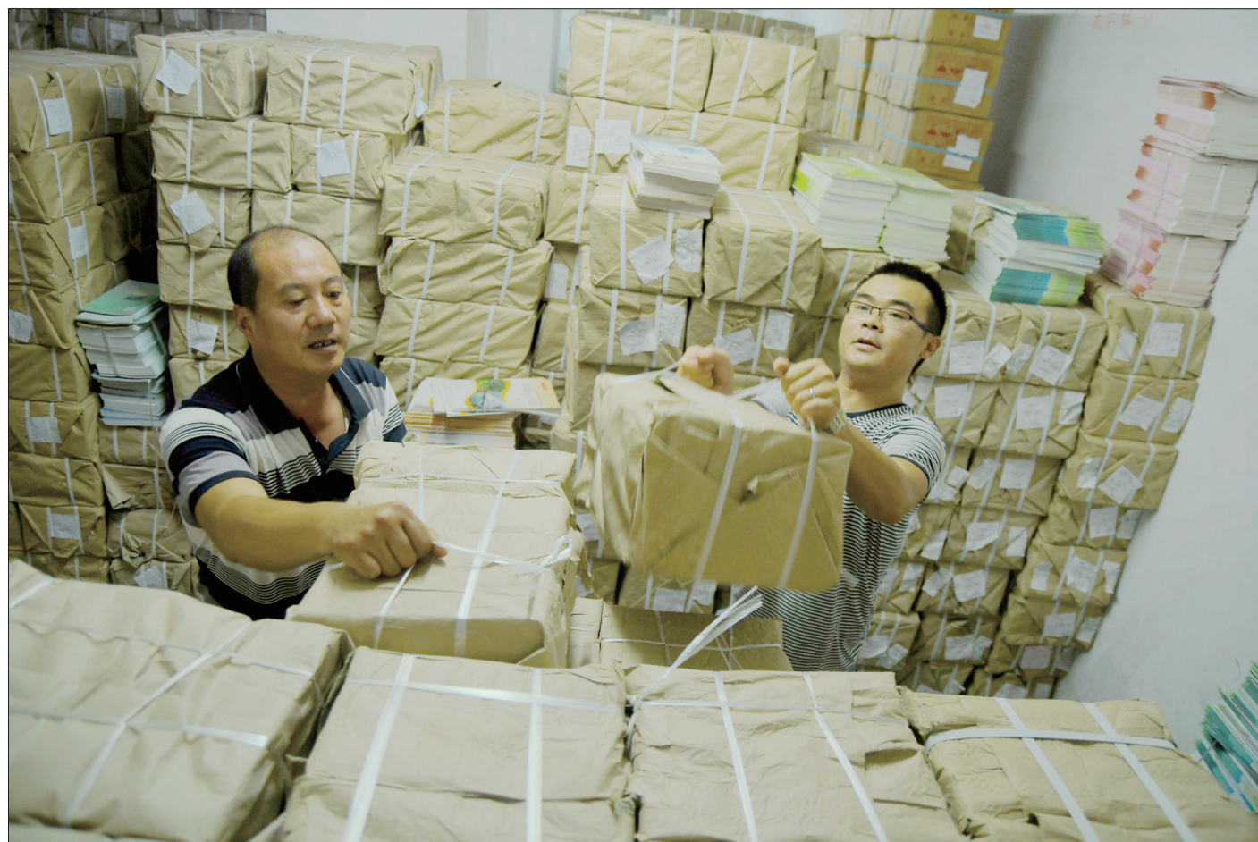
8月24日,城步苗族自治县新华书店的工作人员在搬运新学期的中小学课本。随着中小学开学日期的临近,我市各地开始投入到新教材的整理和分发工作中,确保秋季开学前课本教材全部到位。