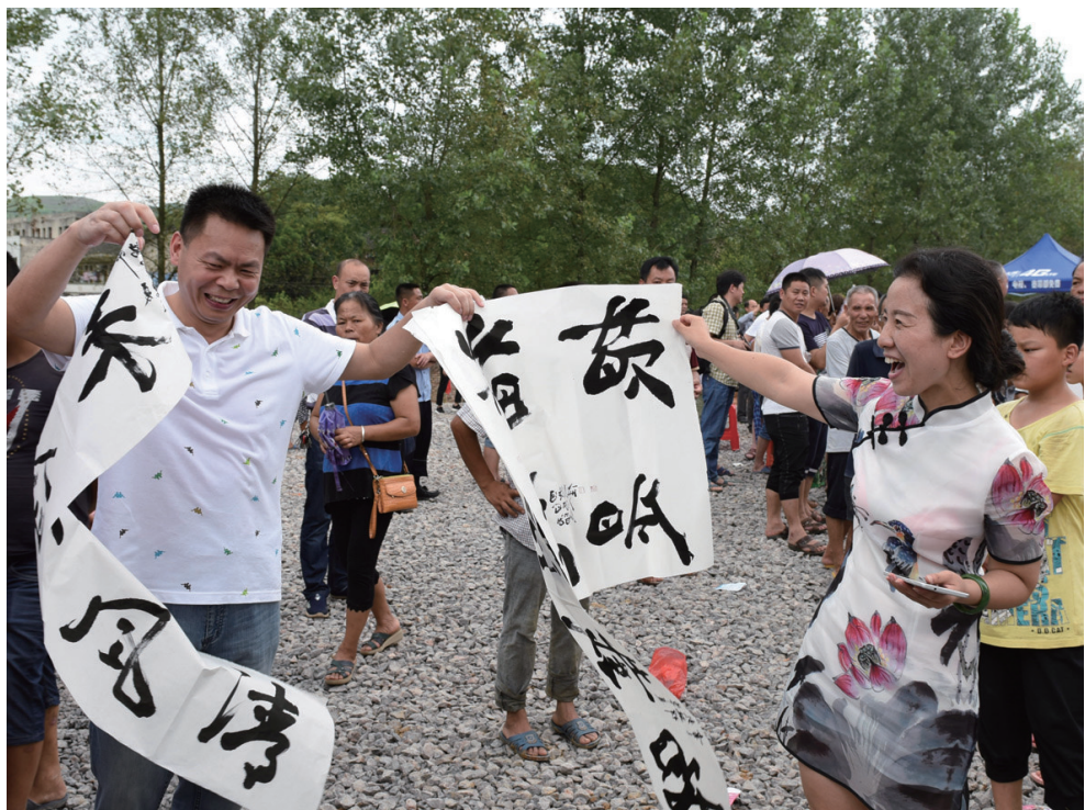
▲ 如获至宝