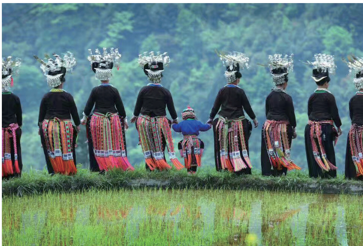
▶ 背后的风景