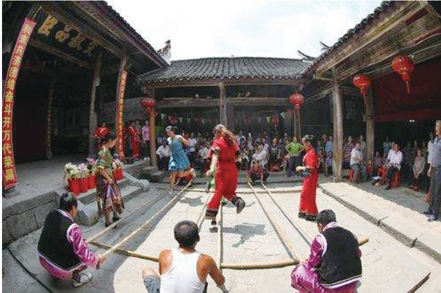
▲城步杨氏后裔在“杨氏官厅”举行纪念活动。