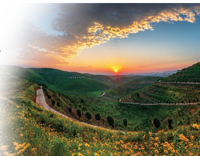
邵阳县白仓镇瓦屋村油茶示范基地。